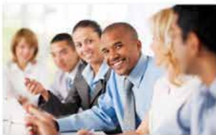
▶ Audit et évaluation technico-financier