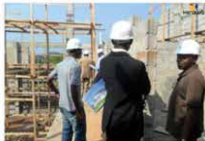
Assistance à la gestion des projets et à la Maitrise d'Ouvrage