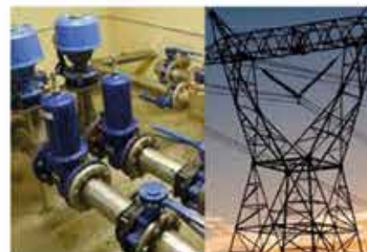
Adduction d'eau potable et électricité