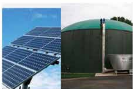
▶ Transfert des technologies