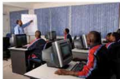
Mise à niveau des techniciens